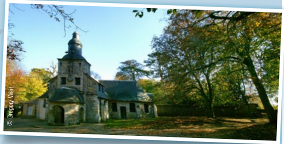
Panorama de la Côte de Grâce