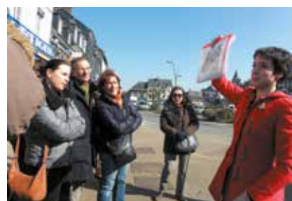
Visite guidée de Beuzeville lors d'un eductour organisé pour nos partenaires