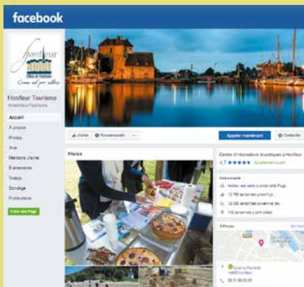
La page Facebook de l'Office de Tourisme 13 720 fans

Avec plus de 380 000 connexions par an, ce site est la vitrine de l'Office de Tourisme, du patrimoine de Honfleur et de sa région, ainsi qu'une source d'informations sur les partenaires de l'Office de Tourisme (hébergeurs, restaurateurs, prestataires d'activité, etc.)