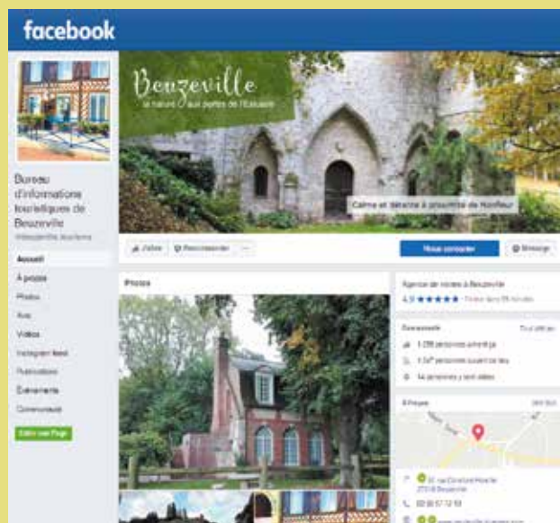
La page Facebook du BIT 1 385 fans