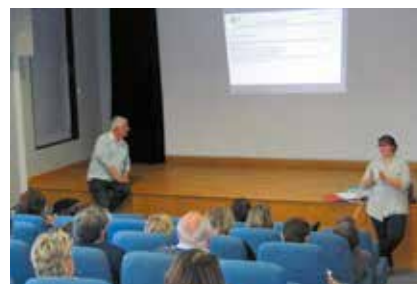
Réunion d'information sur l'accueil des PMR organisée pour nos partenaires