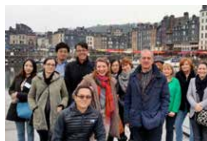
Accueil de voyageurs et de journalistes étrangers pour les Rendez-vous France

En 2018, l'Office de Tourisme était présent au Salon des Vacances de Bruxelles, au Salon des Seniors de Caen (grand public), ainsi qu'au Seatrade Cruise Global de Fort Lauderdale (USA) et au Seatrade Med de Lisbonne (Portugal). Ces derniers sont les plus grands salons professionnels du marché de la croisière. L'Office de Tourisme a également participé à un roadshow en Grande-Bretagne, afin de rencontrer des tour-operators britanniques. Enfin, l'Office de Tourisme a participé aux Rendez-Vous France (le plus grand salon professionnel à destination des prescripteurs de voyages étrangers) et a participé à l'accueil de ces professionnels, à Honfleur, en amont du salon.