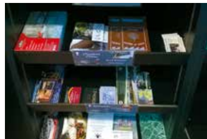
Présentoir en libre accès à l'accueil de l'Office de Tourisme

Votre documentation est mise en avant dans notre espace dédié aux partenaires et est à disposition de tous les visiteurs.