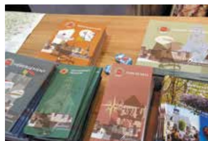
Documentation proposée par l'Office de Tourisme lors du Salon des Vacances

Chaque année, l'Office de Tourisme conçoit et publie notamment un Guide Touristique (36 000 exemplaires) ainsi qu'un Guide Hébergement (13 000 exemplaires) et un Guide Restauration (16 000 exemplaires), traduits en trois langues. Cette documentation est gratuitement mise à la disposition des visiteurs, à la demande à l'accueil de l'Office de Tourisme et téléchargeable sur le site internet de l'Office de Tourisme. En devenant partenaire, vous vous assurez ainsi une bonne visibilité sur tous ces supports de communication, avec, entre autre, des photos de votre établissement et tous les liens utiles pour être contacté par les touristes.